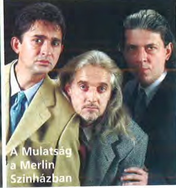
A Multság a Merlin Színházban

■ A magyar drámairodalom nem szűkölködik történelmi művekben, de igazi közönségikert csak kevesen mondhatnak magukénak. A kivételek egyike Németh László Széchenyje. A kétrészes történelmi dráma nem csupán a sokkolóan ellentmondásos kor miatt válhatott megírásakor, 1946-ban jelképpé, hanem főszereplőjének korszakokon túlmutató politikai nagysága miatt is. Széchenyi úgy tudott távlatokban gondolkodni, hogy közben tisztá-